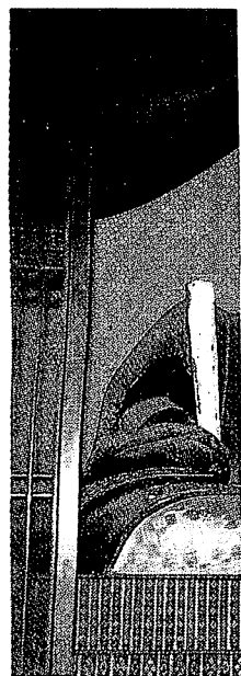
特別公開される摺見寺本堂の織田信長像(安土町・摺見寺)

特別公開は安土城跡入山料五百円の他に特別拝観料千円が必要。対象は高校生以上で、抹茶接待が付く。(北島寛之)